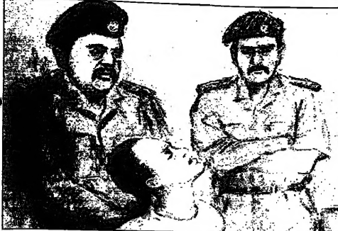
لنشدان ساجديان اوسول مكالان على يد اسيانيل خاندانكاسوسوما لنادي الصبيحة لنادي اوسول